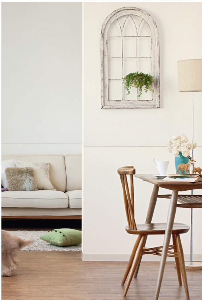
壁紙：BA-6144・6145 クッションフロア：CES-712 施工例写真

ペットを家の中で飼うには、「ペットのため」と大げさに考える必要はありません。 ちょっと選ぶものを考えるだけで、人もペットもみんな暮らしやすい快適な家になります。