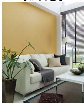
壁紙: BA-6107 施工例写真