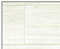
床 E-5001(クッションフロア)