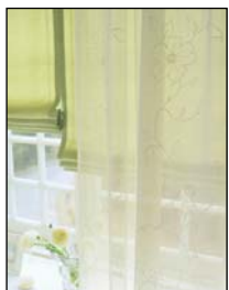
窓 フロントレース

リフレッシュする色で、薄地のカーテンを手前にもってくるフロントレースはさわやかな印象を与えます。