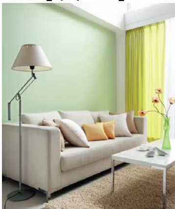
壁紙: BA-6106 施工例写真