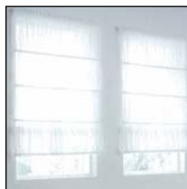
窓 ガザーシェード