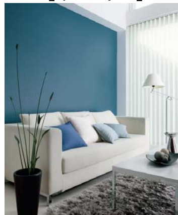
壁紙: BA-6108 施工例写真