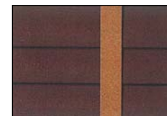
窓 木製ブラインド

場所を選ばず飽きのこない色。木製のブラインドと合わせると、落ち着いた雰囲気を演出します。