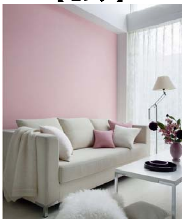
壁紙: BA-6105 施工例写真