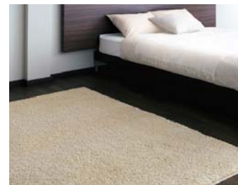
カーペット:SF-6055 施工例写真